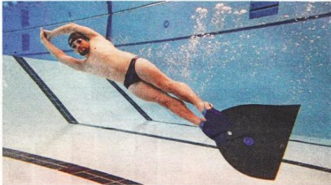
Bestzeiten bei der steirischen Flossenschwimm-Meisterschaft ARY